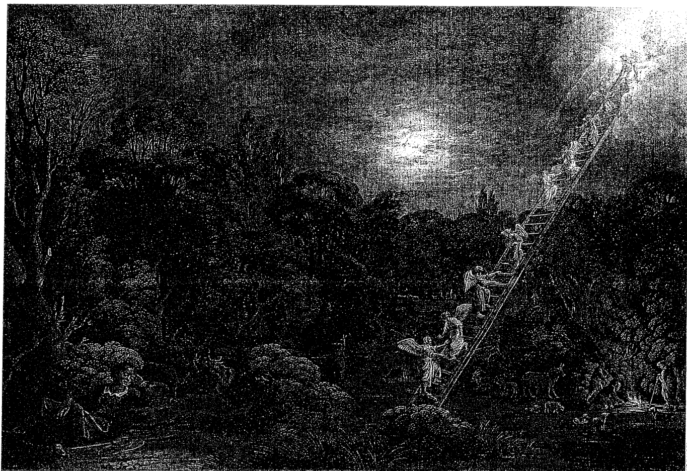
PAYSAGE AVEC L'ÉCHELLE DE JACOB, de Johann Köning (1615).